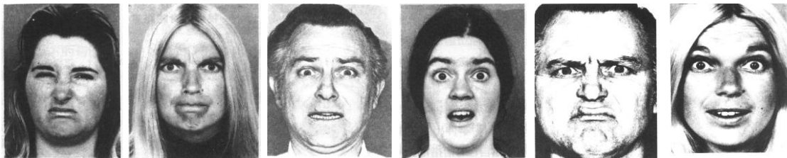
圖三 分別為厭惡、憤怒、害怕、驚訝、生氣與厭惡、驚訝與快樂等臉孔表情

Ekman & Friesen (1975) 主張「害怕、快樂、驚訝、恐懼、厭惡、及悲傷」等六種情緒的表達及理解不受文化影響，為人類共通的基本情緒類別。從情緒智力理論第一分支「情緒覺知表達」的觀點，情緒智力較高者應較低分者能辨識出這六種基本情緒。刺激圖片呈現厭惡、憤怒、害怕、及驚訝等單一情緒有四張圖片，呈現二種以上的混合情緒有二張，分別為生氣與厭惡、驚訝與快樂兩種混合的臉孔表情，因此臉孔表情圖片共計 6 題（如圖三所示）。此分量尺為一客觀之表情辨識，可用來作為自陳情緒智力量尺之檢核。