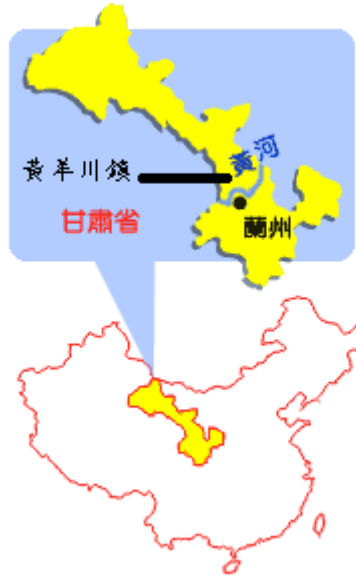
圖二 黃羊川地理位置圖

黃羊川一直以此傳統的思維和方法，持續著其窮苦與絕望的面貌。(黃羊川地理位置圖如下)