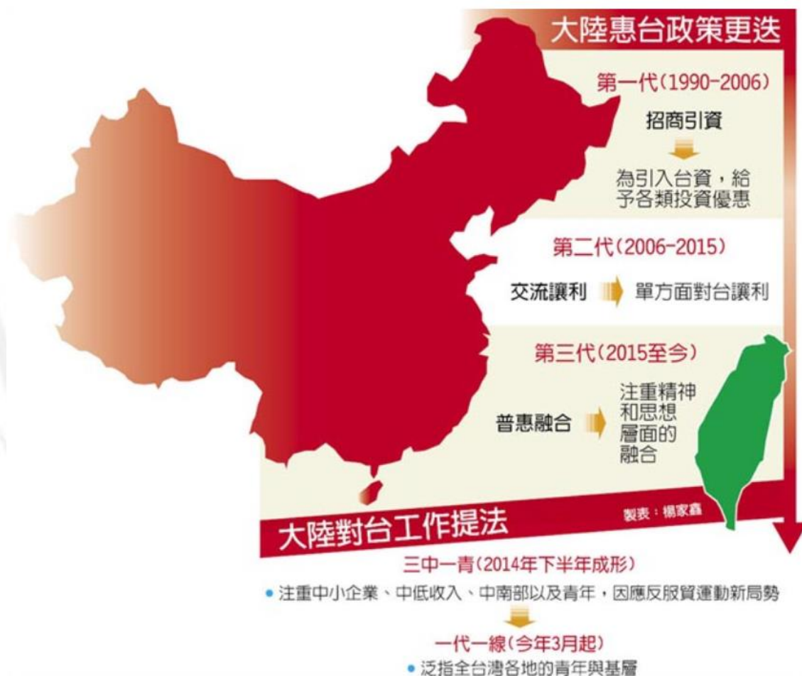
圖 3-1.大陸對臺政策變化示意圖

引更多臺灣的年輕一代至大陸發展，重點範圍已不限於中南部地區，而是全臺灣都包含在其中。由此可以發現，中共對臺統戰的意圖與方向，配合臺灣的社會現況做即時調整修正，以利於隨時發揮效果。 81